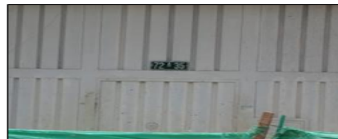
Fotos 1, 2, 3 y 4. Ubicación del predio y aspecto de la obra desarrollada